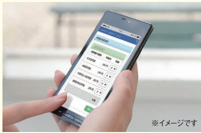
スマートフォンやパソコンで専用サイトにアクセスし、証明書の発行を申請 ※イメージです