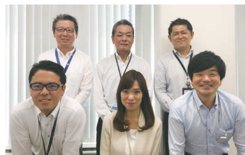
NTT西日本 ビジネス営業本部 アドバンスソリューション営業部 文教担当のプロジェクトメンバー

今回の案件は、国立大学さまで初めての証明書発行サービスの導入になるため、導入による職員さまの業務負担を少しでも解消できるよう、利用者(在学者・卒業生)の利便性の面だけでなく、運用面やセキュリティ面についても、重点的にご提案させていただきました。また、京都大学さまにはシボレス認証システムとの連携や教務データ連携に関するカスタマイズなど、国立大学さまには欠かせないいくつかの機能をご要望いただきました。何度もお打ち合せの機会を頂戴し、通常の業務でお忙しい中でのご協力には大変感謝しています。「サービスを導入して終わり」ではなく、今後もサービスを利用いただいた職員さま・利用者さまのお声を聞かせていただきながら、機能のバージョンアップやより効率的なサービスの利用方法の検討など、さらに本サービスの利用率を向上できるよう、京都大学さまとご一緒に、このサービスを育てていければと考えております。